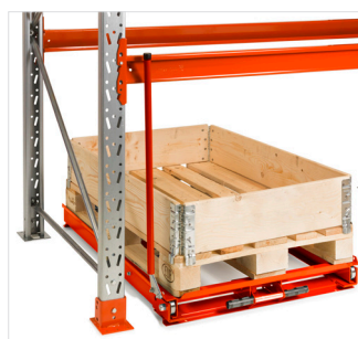
Utdragsenhet monterad på golv.