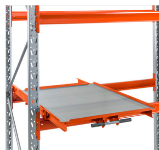
lläggsplåt för plockgods utan pall.