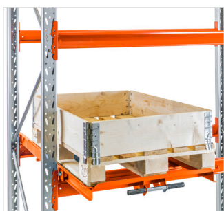
Utdragsenhet monterad på bärbalk i ställage.

Med en lågbyggd utdragsenhet kan du minska avståndet mellan nivåerna i ett pallställ och därigenom komprimera ditt lager.