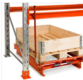
Förhöjningssats för stödbenstruck.