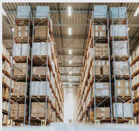
Anpassa höjden på gavlarna efter dina önskemål och behov.