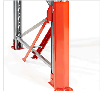
Stolpförstärkning 90/110 hög front - monteras i stolpen och golvet.