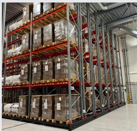
Mobila pallställage - lönsamt alternativ som i det närmaste fördubblar din lagringskapacitet.